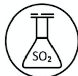
Sulfits Sulphur Dioxide