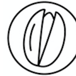
Fruits closca Tree nuts